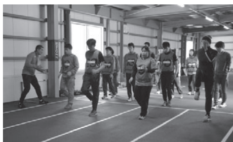
日体大陸上部の監督に指導を受ける学生達