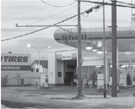
昭和55年、潮見給油所を開設

その頃、鱒浦の住民から近くに郵便局が無くて不便だとの声があり、当時、札幌市にあった郵政省と交渉し、鱒浦に簡易郵便局を設置したそうです。