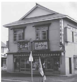
昭和23年、鱒浦に本店を開設

網走市の発展も含め、代表に今後の目標をお聞きしたところ「本年度、網走青年会議所の理事長という役を受けたことも含め、先祖が網走市の発展に尽力してきたことから、自らも先人達に負けないように会社の発展と網走市の子供達の未来に貢献していきたい」と語ってくれました。