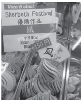
大会に出品した商品「風(なぎ)」

しかし、海外での大会は、材料の確保や、その土地の人が好む味付け等に苦労するそうです。