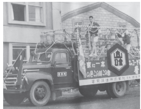
昭和30年頃、花車パレードの様子 醤油樽を積んだトラック