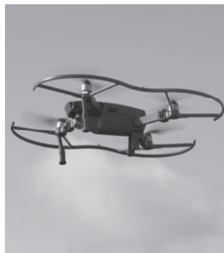
実際に体験会で使用した ドローン（小型無人飛行機）