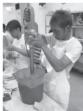
イタリア大会での様子