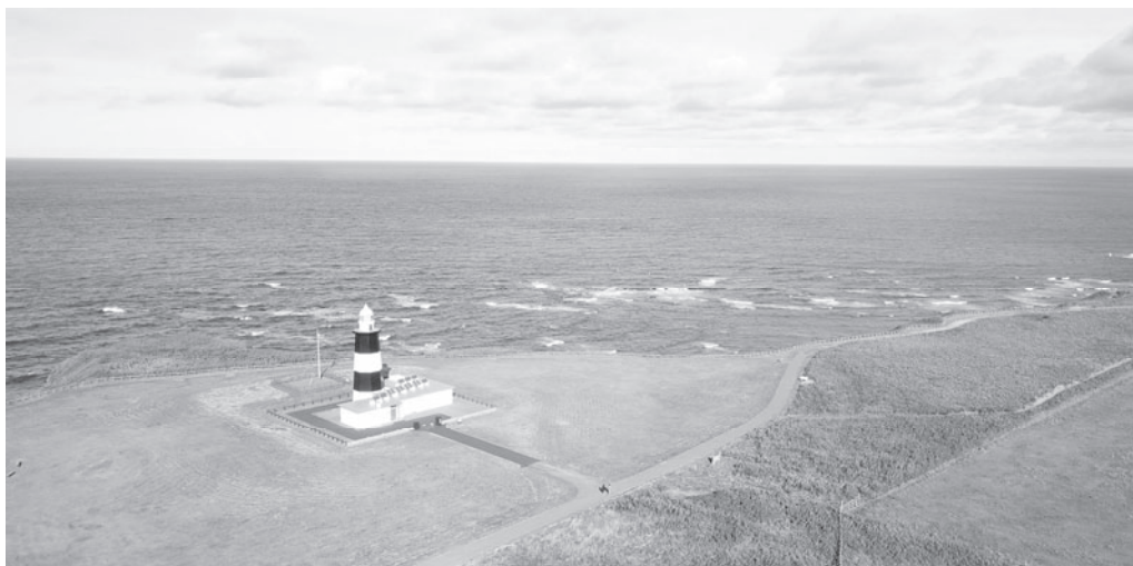
ドローンから撮影した能取岬