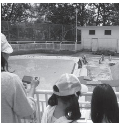
親子で動物園を楽しむ様子

午後1時、動物園から釧路駅に移動し、午後2時14分、釧路発、網走行き普通列車に乗り込み、網走に午後5時14分到着しました。 当日は、天候に恵まれたこともあり、参加した子どもたちや保護者から「列車の中や動物園でとても楽しく過ごせた。釧網本線は、様々な人達に利用されている重要な路線であることが理解できた」と語ってくれました。