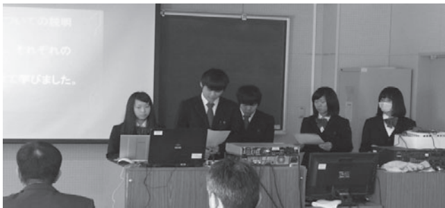
「課題研究」成果発表の様子（昨年）