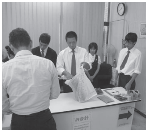
インターンシップを体験する生徒（昨年）

地域に貢献する人材育成に繋がる教育を目標に今後とも内容の充実を図っていくそうです。