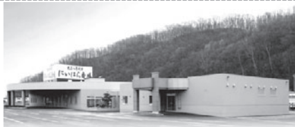
現在の「にいほら斎場」

あらゆる冠婚葬祭に対応していただけますので、お気軽にご相談下さい」と自社のPRも忘れませんでした。