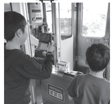
車窓から外の景色を眺める 子供たちの様子