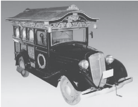
第1号となるシボレーの霊柩車

昭和34年には有限会社にはいほらに社名を変え、平成5年には、株式会社にいほらに組織変更し、これまで取り扱っていた神具、仏具等の葬儀用品以外に、ご祝儀用の商品も取り扱うようにな