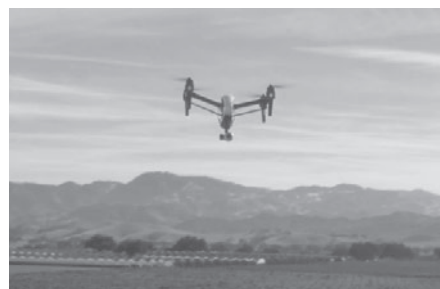
空撮中のドローンの様子

なお、ドローンを使った空中撮影の日程については、撮影機材の借入等も含めて現在、調整中の他、今後の状況につきましては、会報誌において紹介させていただきます。