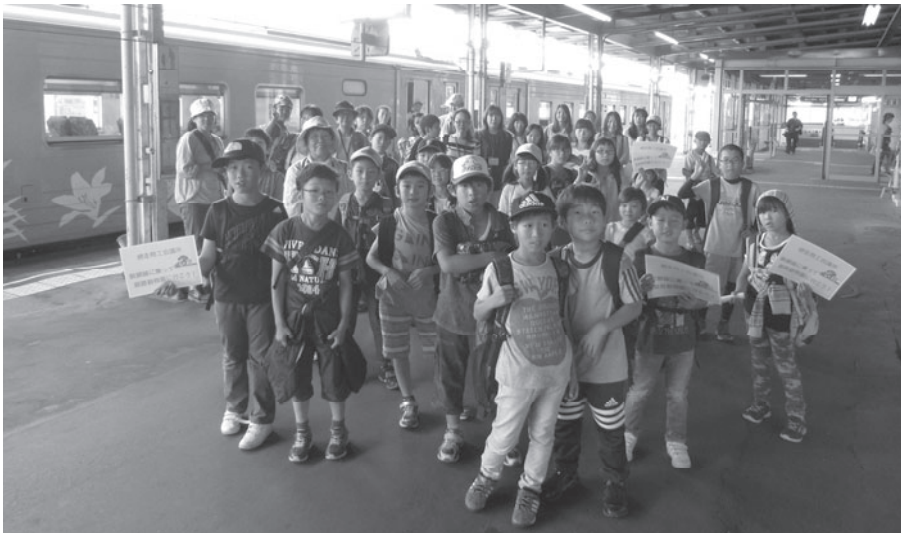
釧路駅、参加した子供たちと一緒に「キハ54 515 快速しれとこ」