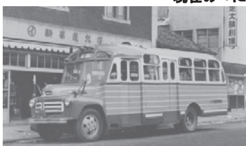
新原造花店(昭和34~35年頃)の写真