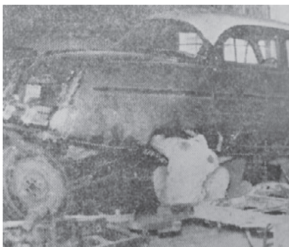
昭和初期の整備の様子

今後もお客様が安全で快適にクルマを御利用いただけるよう車輛整備事業者として誠心誠意取り組んで参りますので宜しくお願ひします」と今後の展望について語っていただきました。