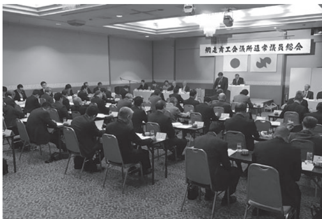
通常議員総会の様子