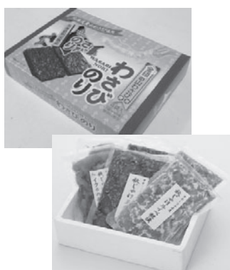
地元産の材料を使った商品