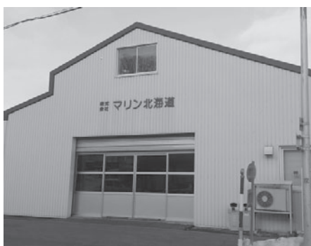
㈱マリン北海道本社

また、商品生産も少ない規模で生産することも可能であることから、これからお客様の要望を真摯に受け止めた商品の販売を進めていきたいと思っております」とのことでした。