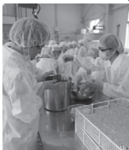
商品開発実習の様子