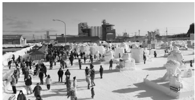
流氷まつり会場内の様子