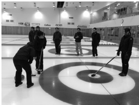
ヒ・コミュニケーションによる実演

その後、「能取湖荘かがり屋」で釣りキンキなど、網走産の食材を使用した食の魅力堪能いただき和やかに終了しました。 また、第35回北海道カーリング選手権で優勝した女子チーム（ヒト・コミュニケーションズ）にハウス中心にストーンを置く実演をしてもらい、参加者はなれない氷上スポーツに悪戦苦闘するも楽しんでいただきました。