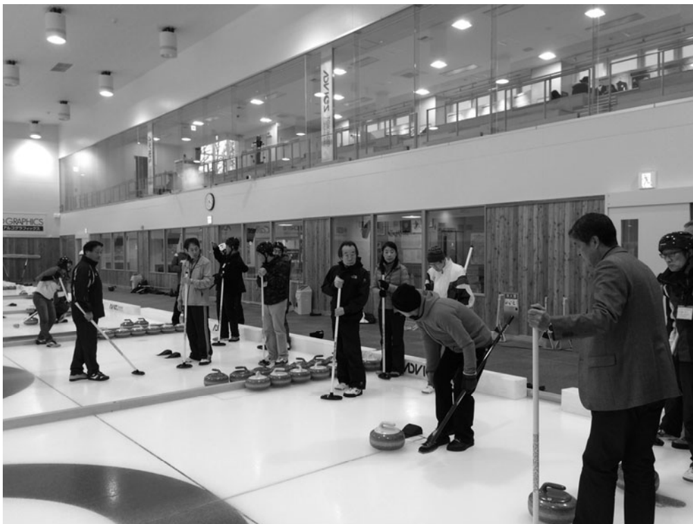
中講師より石の投げ方を学ぶ参加者の様子

あばしりファン倶楽部は、仕事の都合などで網走に住むこととなった企業や官公庁などの転勤者（風の人）に、網走の魅力に触れてもらい網走のファンになってもらうことを目的に開催しております。