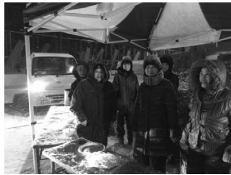
流水まつり制作団体差入れの様子

女性会では、2月2日（火）網走商港埠頭において「第51回あばしりオホーツク流水まつり」の氷雪像制作団体や関係者に対し、毎年恒例の『おしるこ』の差入れを行いました。当日会場では、差入れを受けた制作者から「今年も楽しませていただきました。おしるこのお蔭で身体が温まり、作業がはかどる」など、うれしい言葉が寄せられました。当会は年会費無料で会員事業主、役員の配偶者であればどなたでも入会可能です。ご興味のある方は是非、当所までお問合せ願います。