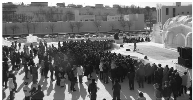
流氷まつりイベントの様子

同まつりには、各企業団体をはじめ多くの皆様のご支援・ご協力を賜り事故無く無事終了することができましたことに感謝申し上げます。