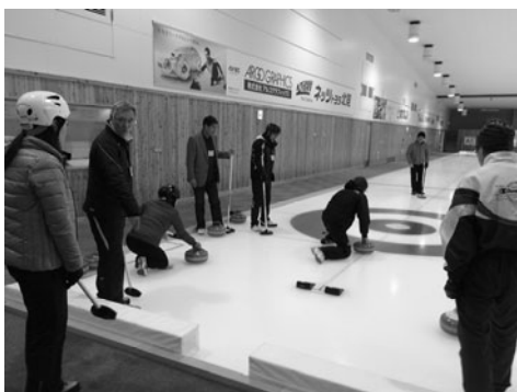
初めてストーンを投げる参加者達

あばしりファン倶楽部は、仕事の都合などで網走に住むこととなった企業や官公庁などの転勤者（風の人）に、網走の魅力に触れてもらい網走のファンになってもらうことを目的に開催しております。